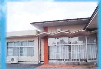
デイサービスセンター 宮前荘