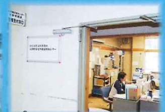
居宅介護支援事業 巨理町在宅介護支援センター