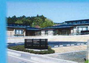
グループホーム 悠里の郷