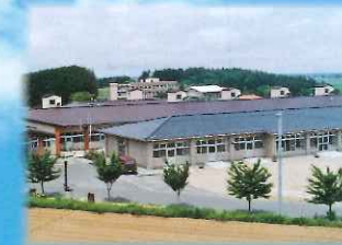
特別養護老人ホーム 日就苑

穏やかな光に満ちあふれる、美しい自然環境と 温暖な気候に恵まれた巨理の郷で、笑顔と活気 あふれる生活を私たちが応援しています。