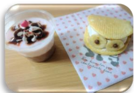
バレンタインデー